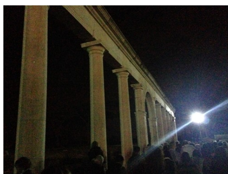
Minturnae: Foto di Gabriele SPARAGNA

molti altri strutture: il Castello Baronale, diverse chiese, la Torre dei Molini, la Torre Quadrata e le Mura Megalitiche. Molti di questi reperti sono stati costruiti per scopi difensivi, come il Castello Baronale, in cui si riuniva la gente per